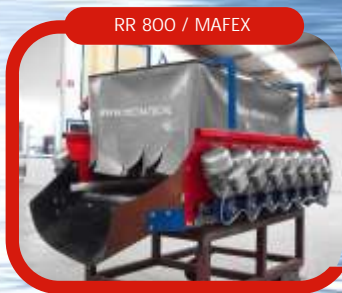
RR 800 / MAFEX

Mechatec bv Het Revier 1 8309 BE Tollebeek T. 0527-760100 info@mechatec.nl