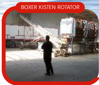
BOXER KISTEN ROTATOR