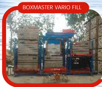
BOXMASTER VARIO FILL