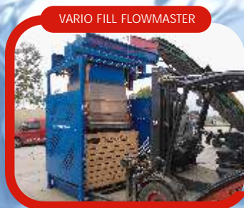
VARIO FILL FLOWMASTER