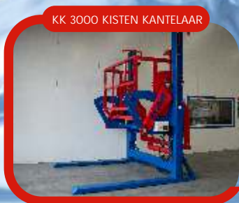
KK 3000 KISTEN KANTELAAR