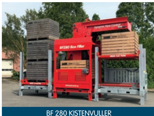
BF 280 KISTENVULLER