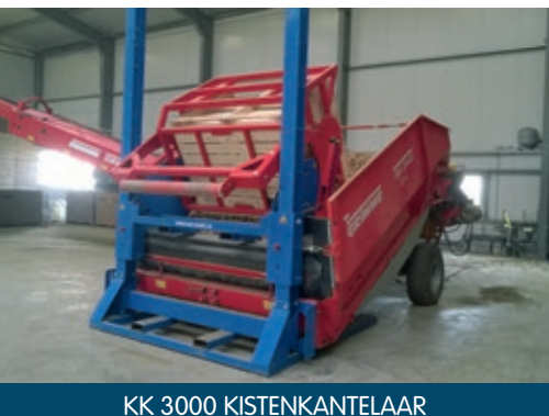
KK 3000 KISTENKANTELAAR